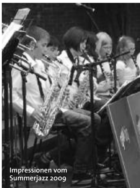
Impressionen vom Summerjazz 2009